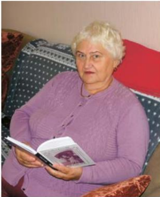
ENE HIJETAM Kandidaat nr 157

Tähtis on see, et vald ikka areneks ja liiguks edasi, mitte ei tammuks paigal. Selle nimel olen valmis kulutama oma aega, et toimuks liikumine ja mitte tagasi vaid ikka edasi, paremuse poole.